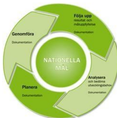
Skolverkets modell av kvalitetsarbetets olika faser.

Piratens förskoleenhet arbetar aktivt utifrån Plan mot diskriminering och kränkande behandling . Planen finns att läsa på kommunens hemsida. Planen utvärderas och revideras av förskolepersonalen en (1) gång om året.