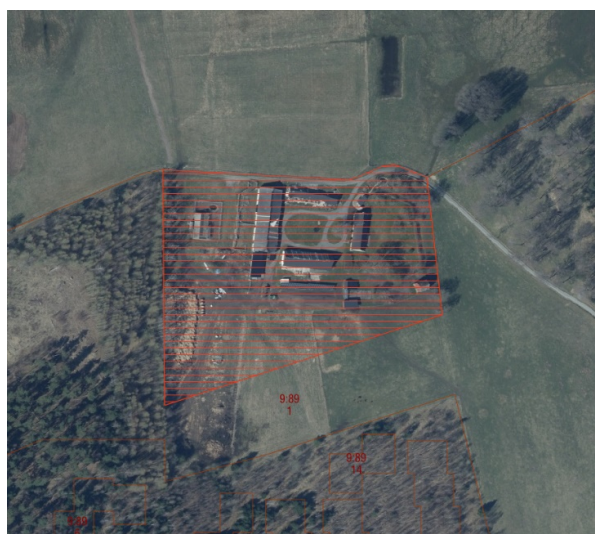
Fastigheten Karup 9:353 med det tänkta upphävda området i rött.

Detaljplanen för området är "byggnadsplan för fritidsbebyggelse å Karups Nygård", fastställd 30 oktober 1972 (kommunens nr 329).